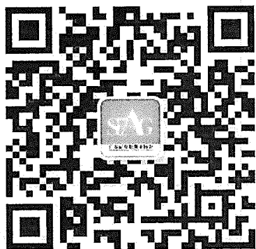
（广东证券期货业协会视频号）

程，将于5月15日8:30-18:00期间通过协会视频号及全景网播放，播放渠道如下：